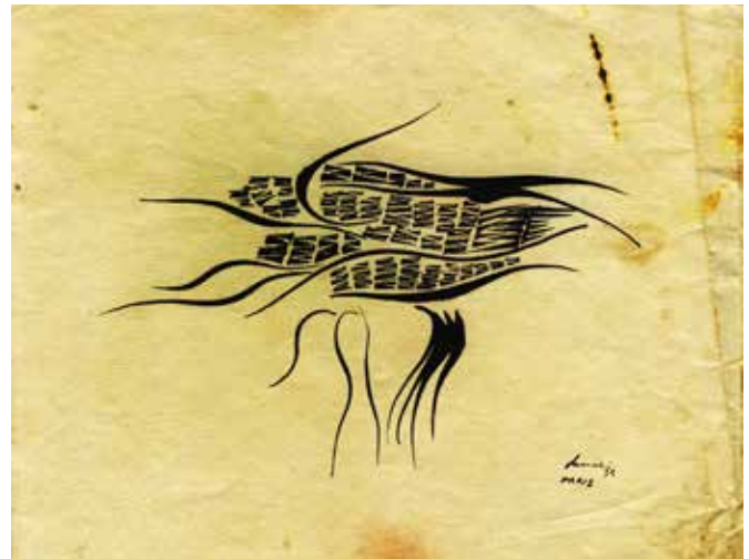
Untitled Sem título mixed media on paper técnica mista s/ papel , 22x17 cm 1954 AB290